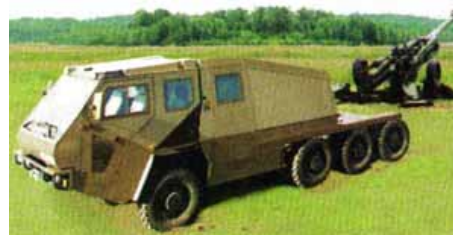
Британская Королевская Артиллерия скоро начнет сравнительные испытания Легких Пушечных Артиллерийских Систем LIMAWS(G).

LIMAWS(G) находится в стадии оценки. Она включает в себя запросы информации, комплексные испытания подвижности и общих характеристик, которые начались в июне. Программу курирует подразделение Агентства по оборонным закупкам (DPA).