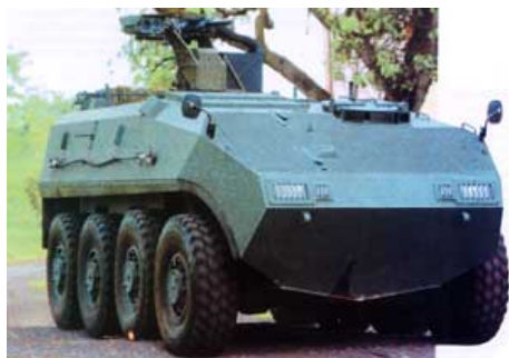
Бронетранспортер Terrex 8x8 сингапурской фирмы ST Kinetics был впервые представлен в

Отсрочка дала возможность фирме ознакомиться с поведением конкурентов, изучить их позитивные и негативные стороны.