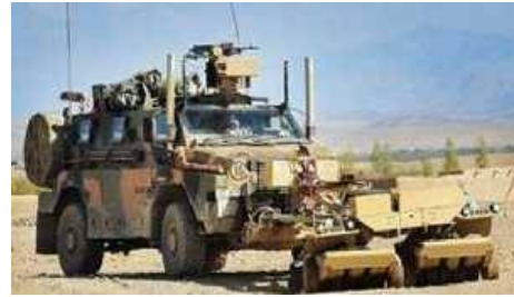
1000-ая машина Bushmaster будет выпущена на заводе Thales Australia в Бендиго 14 июня 2013 года, она будет поставлена Вооруженным Силам Австралии.

Bushmaster является австралийским успешным проектом, машиной, поставляемой для ADF (Австралийские вооруженные силы), местной оборонной промышленностью, она использует внутренний производственный потенциал предприятий Австралии.