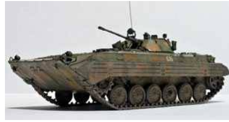
Индийцы планируют ускорить программу модернизации находящихся на вооружении БМП-2 российского производства.

В ближайшие три – пять лет будут модернизированы более 1500 БМП-2 суммарной стоимостью свыше 1,2 миллиарда долларов. Программа уже получила официальное одобрение Минобороны страны. В ее рамках Нью-Дели планирует объявить тендер на поставку 2000 двигателей для БМП. Тендерная документация направлена индийским и зарубежным поставщикам. Это такие индийские компании, как Mahindra & Mahindra, Tata Motors, Force Motors, Ashok Leyland, Maruti Udyog и Crompton Greaves, а также немецкая фирма MTU, французская Thales и российский Рособоронэкспорт. Армии Индии потребуются двигатель мощностью 350–380 лошадиных сил, простой в эксплуатации и обслуживании и пригодный к использованию в сложных погодных условиях.