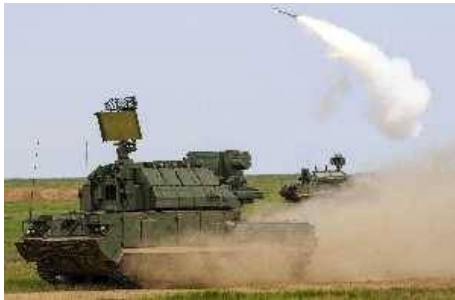
Зенитный ракетный комплекс (ЗРК) малой дальности «Тор-М2У» на гусеничном шасси примет участие в Параде, посвященном 69-годовщине Победы в Великой Отечественной войне.

Участие в Параде Победы батареи из четырех боевых машин ЗРК «Тор-М2У» производства ижевских оружейников являет собой прекрасное доказательство высокой надежности выпускаемой на ИЭМЗ «Купол» техники военного назначения, свидетельствует о высокой оценке и доверии к этому типу вооружения со стороны Министерства обороны Российской Федерации. Военные специалисты России и ряда других стран не понаслышке знают и понимают весь оборонительный и огневой потенциал нашего комплекса. Потому глубоко символично, что в Параде Победы 9 мая 2014 года примет участие именно оружие обороны, а не нападения.