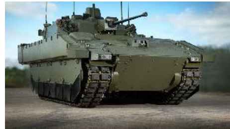
Компания General Dynamics UK сегодня представила опытный образец платформы AJAX, ранее известной как SCOUT SV на международной выставке DSEi 2015.

Компания впервые продемонстрировала вариант семейства на базе гусеничного бронетранспортера в прошлом году. Флагманский вариант программы AJAX, вооруженный башней, является вторым опытным образцом из этого семейства, который будет представлен General Dynamics UK, и первым который продемонстрирует башню, разработанную для данной программы Lockheed Martin UK. Эта башня предназначена для удовлетворения потребностей современной британской армии.