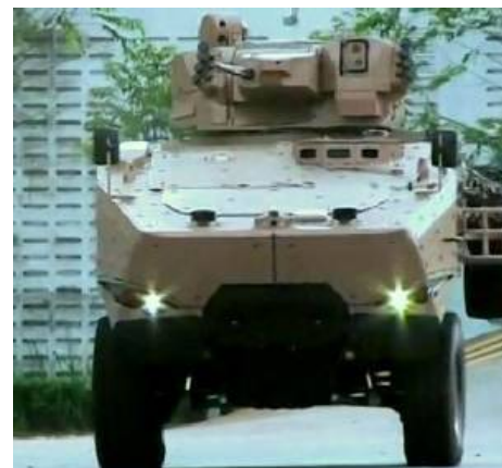
Сингапурская компания Singapore Technologies