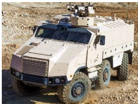
Czechoslovak Group (CG) 31 мая 2016 года