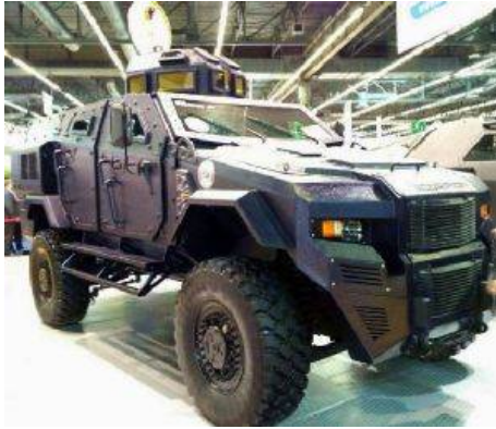
STREIT Group, канадский производитель бронированных машин, продемонстрировала бронетранспортер Scorpion во время выставки Milipol 2017 в Париже.

По данным компании, Scorpion является машиной с защитой от от мин и засад, разработанной для команд тактического реагирования и сил спецназа, при этом может быть приспособлен для множества военных применений.