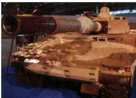
BAE Systems Hagglunds продолжают заниматься