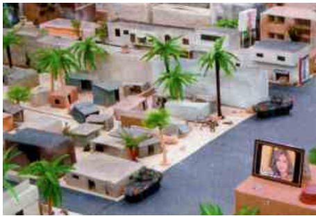
Автоматически управляемые машины ездят по улицам миниатюрного города. Для испытания машин армии США используют игрушечных солдатиков и коробки из-под еды для кошек?

Тут должно быть какая-то ошибка? В эпоху виртуальной реальности, когда тренажеры становятся цифровыми произведениями искусства, кто осмелится использовать макеты?