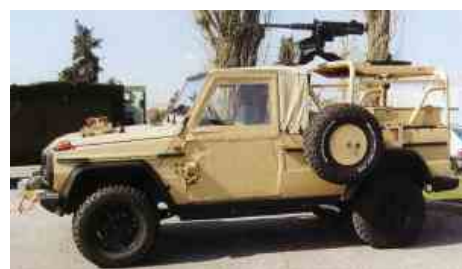
Командование специальными операциями