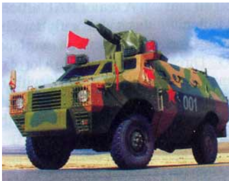
Компания Shaanxi Baoli Special Vehicles Manufacturing Company ищет иностранных заказчиков на бронетранспортеры ZFB05.

Около ста машин было продано на внутреннем рынке, некоторые из них используются Китайскими войсками при участии в операциях ООН.