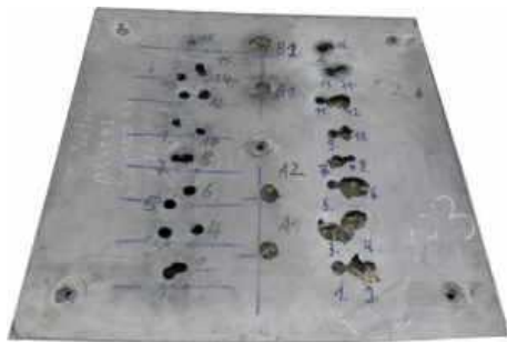
Немецкая компания IBD сделал значительный шаг вперед в легких и экономичных решениях для защиты, развивая четвертое поколение технологий брони.

В презентации, представленной президентом IBD Ульфом Дисентрофом на пленарном заседании конференции IAV 2010 в Лондоне, среди прочего подчеркнул, что с введением нано-технологий достигнуты существенные улучшения в области решений для защиты.