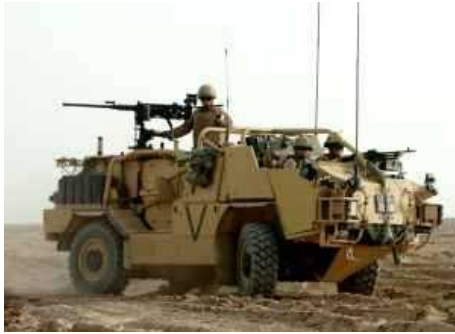
Машины специального назначения выполняют функции патрулирования, разведки и непосредственного участия в боевых операциях.

Большое разнообразие конструкций бронированных джипов использовалось для проведения операций на различных участках боевых действий, включая такие разные регионы, как Западная Сахара и Европа.