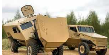
Патрульная машина с легкой защитой Ocelot фирмы Force Protection, Inc. выбрана австралийским правительством для участия в проекте, цель которого создать опытный образец мобильной машины (PMV-L) с легкой защитой.

Фирма Force Protection, Inc., ведущий разработчик и изготовитель машин с повышенной живучестью. Она обеспечивает техническую поддержку своих изделий в течение всего жизненного цикла.