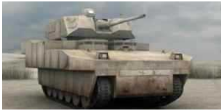
Армия США объявила о возобновлении работ по программе GCV (Ground Combat Vehicle — Наземная боевая машина) и опубликовала Запрос предложений на реализацию программы (RfP).

Ранее американская армия уже начинала формирование требований и стратегии закупок по программе GCV, в соответствии с которой первая ее часть - боевая машина пехоты, должна была быть создана в течение семи лет. Программа Ground Combat Vehicle является преемником программы Future Combat Systems (FCS), которая в прошлом году была аннулирована министерством обороны США. В феврале 2010 года был сделан первый заказ на боевую машину пехоты, но уже в августе его аннулировали в связи с завышенными рисками реализации.