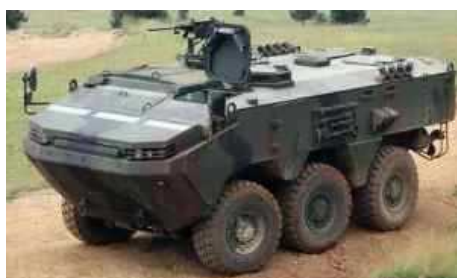
Турецкий ведущий производитель наземных

Контракт на сумму свыше 10,6 млн. долл. США распространяется на машины, запасные части и подготовку кадров. Поставки по данному контракту, как ожидается, будут завершены в течение 15 месяцев.