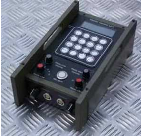
Компания AT Communication представляет новую улучшенную систему тактической внутренней связи и коммутации.

Система состоит из 6 основных модулей, которые позволяют создавать систему, отвечающую требованиям Заказчиков с возможностью ее расширения. Основные компоненты системы: