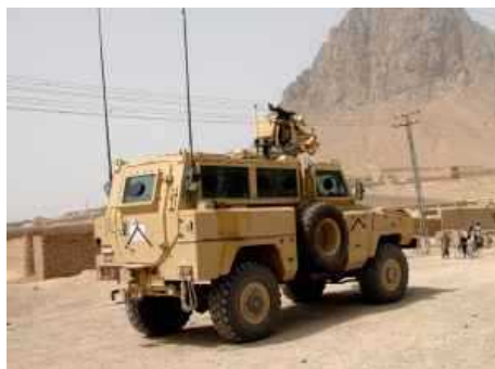
Корпус морской пехоты США заключил с General Dynamics Land Systems-Canada договор стоимостью 21,2 млн. долл. США.

Предметом договора является поставка компонентов для обновления машин с защитой от мин и засад (MRAP) RG-31 Mk5E. General Dynamics Land Systems-Canada, является канадским подразделением американской компании General Dynamics.