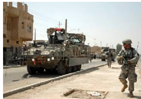
Stryker должен был стать временной мерой до того, как будут готовы к развертыванию Перспективные боевые системы (FCS).

В реальности Stryker изначально назывался