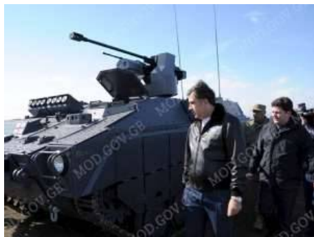
25 февраля Министерство обороны Грузии продемонстрировало во время стрельбовых испытаний на полигоне в Вазиани новую гусеничную боевую машину пехоты Lazika.