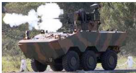
Бразильская армия и компания Iveco подписали