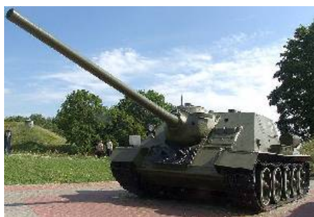
Истребитель танков — специализированная, полностью и хорошо бронированная

самоходно-артиллерийская установка (САУ) для борьбы с бронетехникой противника. Именно по своему бронированию истребитель танков отличается от противотанковой САУ, которая имеет лёгкую и частичную броневую защиту.