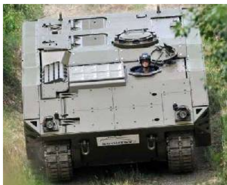
Специализированная машина (Specialist Vehicle - SV) уже тянет больше, чем весит, в качестве основного шасси перспективной программы AFV (Armoured Fighting Vehicle - Боевая бронированная машина).

Мобильная испытательная установка (Mobile Test Rig - MTR) для программы SV, которая была выведен на испытания General Dynamics в июне 2012 года, отбуксировала поезд, весом в общей сложности 92 тонны на расстояние более, чем 300 км, подтвердив этим уверенность в способности SV обеспечить достаточно мощности для удовлетворения всем требованиям, с учетом ожидаемого роста в течение следующих 30 лет.