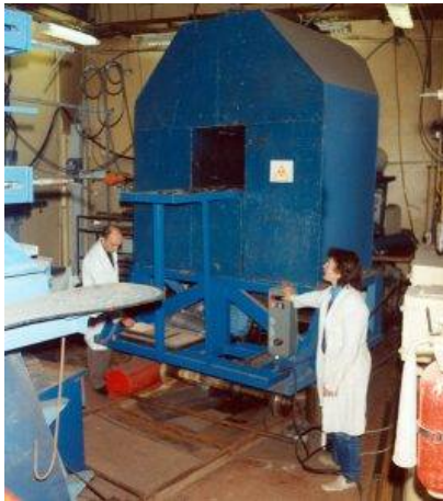
>Рис. 2. Моделирующая установка с нейтронным генератором

В рамках второго направления исследований специалисты института разрабатывали расчетные методы и методики измерений защитных характеристик как создаваемых материалов, так и самих изделий. Эти работы требовали колоссальных расчетов, поэтому институту специально были выделены самые мощные на тот период ЭВМ.