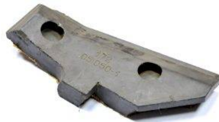
>Рис. 4. Элемент ПРЗ

Впоследствии были проведены работы по созданию слоистых материалов, обладающих более рациональным распределением защитного вещества. Это позволило уменьшить стоимость материала при сохранении его защитных характеристик. Такие материалы были установлены на серийных объектах. Дальнейшие работы были направлены на совершенствование программного обеспечения расчетов, поиски новых композиционных материалов, обладающих комплексом свойств.