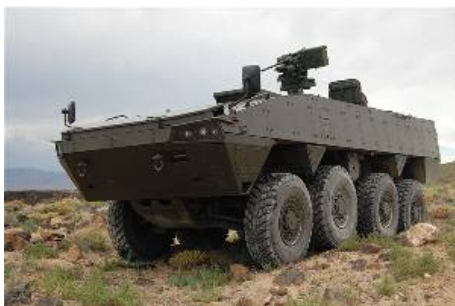
Бронированная модульная машина (AMV) Navos 8x8, которую предлагает корпорация Lockheed Martin, успешно прошла сравнительные тесты на полигоне испытательного центра в Неваде, на

Развиваемая совместно с финской компанией Patria, машина Navos является предложением корпорации Lockheed Martin Корпусу морской пехоты США для программы ACV (Amphibious Combat Vehicle - Плавающая боевая машина).