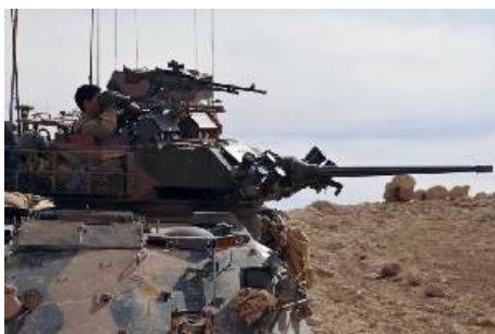
Новые машины придут на смену нынешнему парку из 257 австралийских легких бронированных машин (ASLAV) - на базе Piranha III от General Dynamics.

Новая машина с колесной формулой 8x8 должна иметь значительно больший вес, значительно более высокий уровень защиты и электронную архитектуру, поддерживающую современное оборудование, что является необходимым шагом к полностью цифровой наземной боевой машине, которая должна быть создана в рамках очередного,