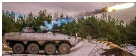
В башне ZSSW-30, которую польская компания

Концепция новой польской башни польского блока предполагает ее полную взаимозаменяемость с башней HITFIST-30P, т.е. новая ZSSW-30 должна устанавливаться на колесные боевые машины Rosomak без каких-либо изменений в корпусе. Обе башни имеют одинаковые погон и вращающееся контактное устройство. Кроме того, различия в распределении масс обеих систем будут