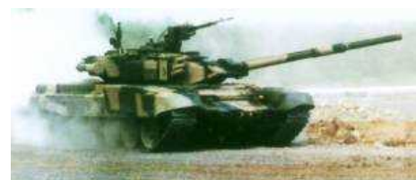
Россия подписала с Индией новый контракт на поставку 330 основных боевых танков Т-90С в виде полного комплекта всех составных частей.