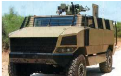
Бронированная машина «Golan» разработана для боевых операций в городских условиях по запросу Сил Оборона Израиля.

Фирма Rafael (Израиль) и фирма Protected Vehicle Inc. (шт. Южная Каролина, США) - изготовитель машин, стойких к воздействию мин - объединили свои усилия по созданию новой бронированной боевой машины (БМ) с колесной формулой 4x4 для потенциальных заказчиков Израиля и США.