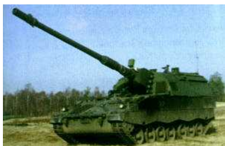
Впервые в боевых операциях применены 155-мм самоходные гаубицы PzH 2000, изготовленные фирмой Krauss-Maffei Wegmann (ФРГ).

В заявлении от 5 сентября 2006 г. Министерство Обороны (МО) Голландии заявило, что две из трех гаубиц PzH 2000, находившихся в провинции Урузган (южный Афганистан), передислоцировались в соседнюю провинцию Кандагар для поддержки канадского и афганского контингента войск численностью 2000 человек, принимающих участие в операции «Медуза».