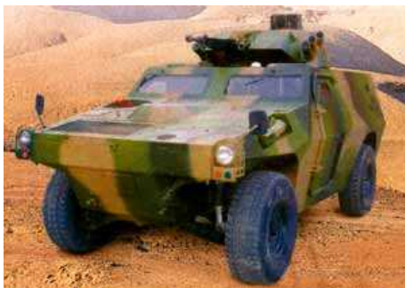
Китайская фирма North Industries Corporation (Norinco) разработала новую легкую бронированную машину под названием VN3.

В настоящее время машина находится в мелкосерийном производстве и предназначена для Китайской Народной освободительной армии.