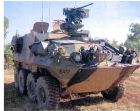
Австралийские Вооруженные Силы (ADF) получили девять новых дистанционно управляемых боевых модулей Protector фирмы Kongsberg.

Системы Protector будут поставлены в феврале 2005 года. Подразделением ADF в мельбурне они будут установлены на бронетранспортере 8x8 ASLAV, австралийском варианте американских Stryker.