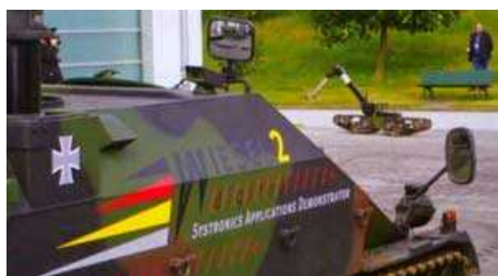
Германский подрядчик в области оборонной промышленности - фирма Rheinmetall Landsysteme проводит экспериментальные работы, связанные с боевыми роботами, управление которыми производится по сети.

Производитель уделяет внимание таким критериям, как мобильность, защита, живучесть, командование и контроль.