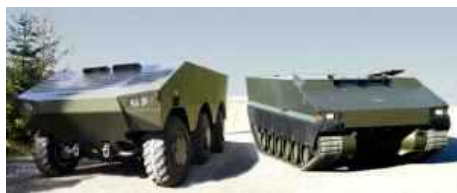
Бронированная машина (SEP), разрабатываемая для шведской армии, должна была стать одной из самых современных наземных боевых машин.

SEP достаточно универсальна благодаря модульной конструкции, а также двум вариантам исполнения ходовой части — колесному и гусеничному с асфальтоходными башмаками.