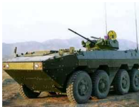
Китайская государственная корпорация NORINCO предложила рынку свою новую разработку — VN1, колесный бронетранспортер с колесной формулой 8x8.

Уже много лет основным колесным бронетранспортером, состоящим на вооружении китайской народно-освободительной армии оставался WZ 551 с колесной формулой 6x6. На его базе было создано много разных машин. В ограниченных количествах WZ 551 поставлялся и на экспорт.