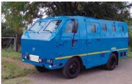
Южноафриканская фирма ОТТ Technologies (Pty) Ltd предлагает недорогой колесный бронетранспортер.

Экономическая эффективность достигается за счет того, что новый бронетранспортер сделан на базе хорошо отработанного коммерческого грузовика повышенной проходимости Hino Series 300 815. В бронированном виде по мнению разработчиков машина идеально подходит для полицейских и спецподразделений.