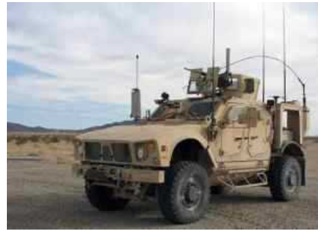
Парк армии США пополнился машинами, которые оснащены встроенными сетевыми комплектами связи (NIK).

вторичного поражения осколками в случае пробития основной брони БТР. Помимо повышения защитных свойств, установка противоосколочной защиты улучшает термо- и шумоизоляцию обитаемого отсека бронетранспортера, а также его эргономику.