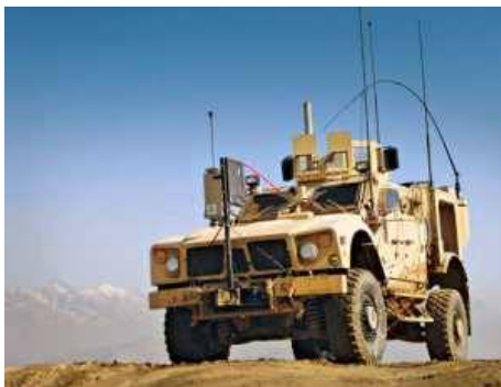
Американская компания Oshkosh Corp. Получила контракт стоимостью $ 97 146 579 на 177 машин с защитой от мин и засад повышенной проходимости с установленным пакетом