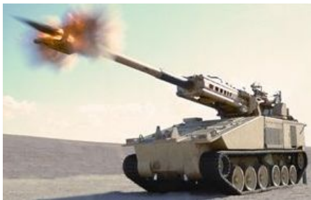
Самоходная установка NLOS-C (артиллерийская система для ведения огня с закрытых позиций), создаваемая по программе FCS, за время проведения полевых испытаний выпустила более 1000 снарядов.

Программа FCS (Перспективные боевые системы) отличается размахом планов, однако постоянно сталкивается с проблемой слишком высокой цены. Данная машина выглядит наиболее завершённой из всех типов машин, предусмотренных программой FCS. Так вышло потому, что ко времени отмены программы Crusader разработчик этих обеих машин, United Defense уже имел готовое гусеничное шасси. В результате, United Defense всего через шесть месяцев после прекращения работ по Crusader смогла разработать и испытать NLOS-C. От Crusader в этой машине осталась 155 мм гаубица M777 с длиной ствола 39 калибров, автомат заряжания и 20-тонная высококомобильная гусеничная платформа с гибридным дизель-электрическим приводом. В магазине в настоящее время размещается 24 снаряда для гаубицы. Несмотря на впечатляющий внешний вид, данная машина является только демонстрационным образцом, а не законченной самоходной гаубицей.