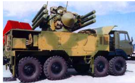
Израильская газета «Гаарец» сообщила о том, что Россия продолжает вооружать Сирию. Недавно между двумя странами был подписан договор о поставках новейшей системы ПВО «Панцирь».

Сергей Чемезов, генеральный директор тульского завода-производителя установок «Панцирь» отметил, что техника будет передана покупателю в ближайшем будущем.