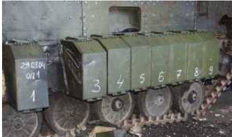
Фото НИИ Стали, 2004 г.

Рис.6. Результат попадания гранаты ПГ-9В в борт БМП-2, защищенного ДЗ с ЭДЗ 4С24. Пробития нет. Из строя вышел только 1 блок.