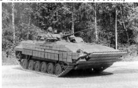
фото НИИ Стали, 1988 г

Еще в 1988 году Россией были предприняты попытки адаптировать к ЛБМ комплексы ДЗ, которые к тому времени уже широко применялись в защите танков. На рис. 1 и рис.2 показаны первые комплексы ДЗ типа «Контакт» с элементами динамической защиты (ЭДЗ) 4С20 [3] на БМП-2. Натурные испытания этих комплексов, однако, показали их полную непригодность для использования в защите ЛБМ. Тонкая броня при совместном взрыве блока ДЗ и гранаты, когда суммарная масса подрываемого ВВ достигала 1,1-1,2 кг, просто проламывалась, выводя из строя саму машину (рис.3.). Тем не менее усилиями разработчиков НИИ Стали в России в 1999 году был создан работоспособный комплекс ДЗ на базе танкового ЭДЗ 4С20 для БМП-3 [4]. Масса этого комплекса составляла 4 т (рис.4). Комплекс обеспечивал защиту основных проекций БМП в курсовых углах \pm 180^\circ от гранат типа ПГ-9ВС, пробивающих до 500 мм стальной брони. Одновременно повышался уровень защиты БМП-3 и от боеприпасов стрелково-пушечного оружия.