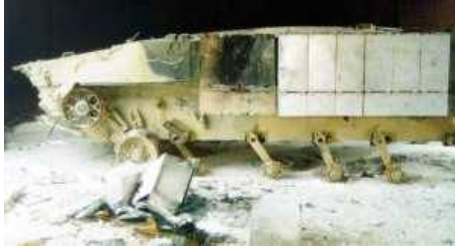
Фото НИИ Стали, 1999г.

Рис.5. Результат попадания гранаты ПГ-9В в блок левой секции ДЗ БМП-3с ЭДЗ 4С20. Пробития брони нет, но выведены из строя 6 блоков ДЗ, включая 3 нижних.