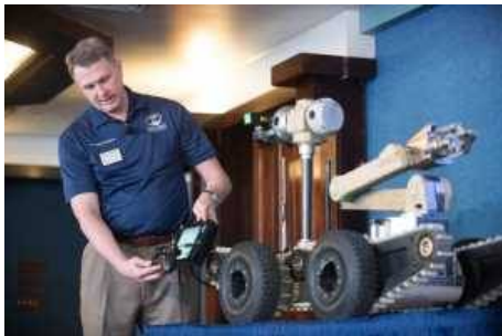
Следующее поколение беспилотных наземных машин легче, быстрее, сильнее и умнее

Remotec Inc., дочернее предприятие Northrop Grumman Corporation, начнет в декабре поставки Titus, новейшего и самого маленького члена их линейки беспилотных наземных машин (UGV) Andros.